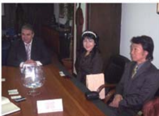
Во посета кај градоначалникот